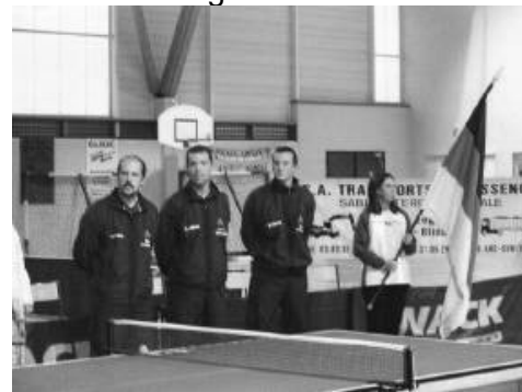
Drapeau allemand : Oberharmersbach

Comme prévu, la nationale 3 est encore trop forte pour notre équipe 1 (une seule victoire). 7 équipes engagées dans le championnat senior dont une équipe féminine (grande première sous la "houlette" de Gigi).