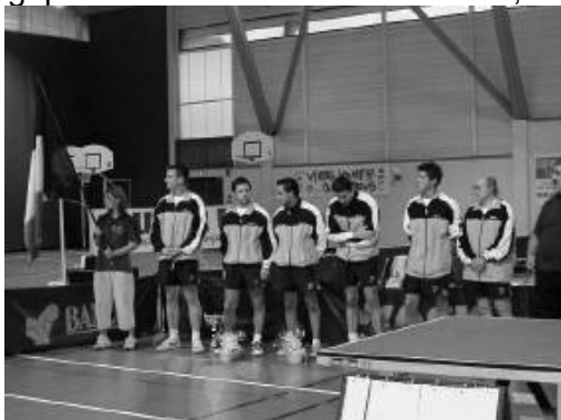
Drapeau français : Belleneuve

Hélas, elle n'a pu être prête pour le 1er match européen du club contre les Allemands d'Oberharmersbach en coupe d'Europe "TT Intercup". Le deuxième match se fera en Belgique contre l'Etoile Basse Sambre, club de super-division Belge.