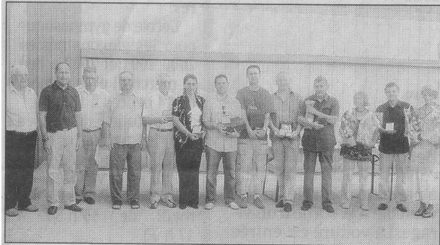
Les personnalités entourant les récompensés

Samedi, le club pongiste belleneuvois a fêté ses 25 ans.