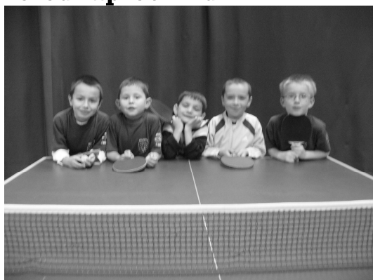
Baby Ping 17h - 18h