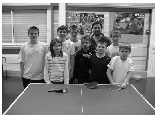
17h – 19h