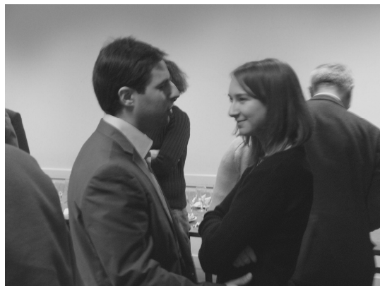
Le réconfort bien mérité...