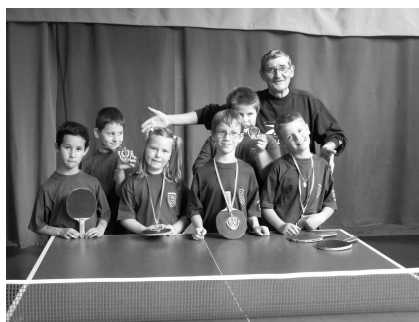
Groupe détection à Belleneuve