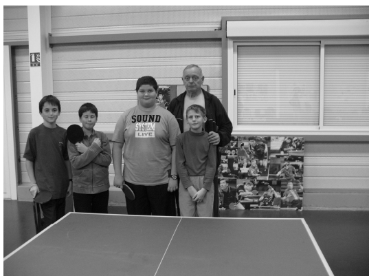
15h – 16h30 (manque Mathieu)