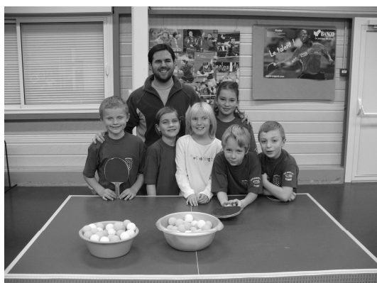
14h – 15h30