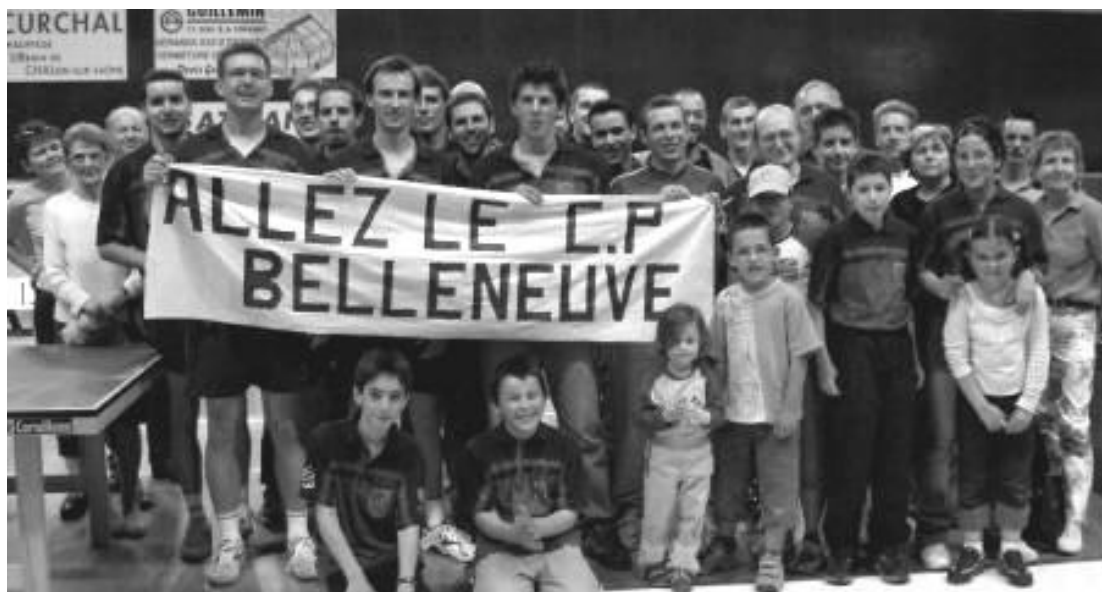
Joueurs et supporters après la victoire sur Longvic