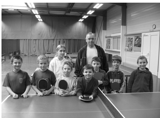
13h30 – 15h (manque Mathieu)