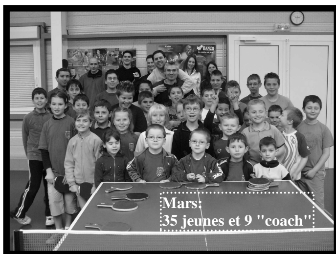
Mars: 35 jeunes et 9 "coach"!

De plus en plus de jeunes inscrits aux stages + un nombre de coachs toujours plus important = PROGRESSION (pour les jeunes) et FIERTÉ (pour le CPB) !!! Les vacances ne stoppent pas l'envie d'apprendre de tous ces jeunes et c'est tant mieux. Quel bonheur de voir pendant 2 jours une salle remplie et tout un groupe de jeunes sérieux et motivés. La formule proposée (entraînement, jeux, repas « picnic » ou au centre social, séances vidéos, goûter) plaît toujours, aussi bien aux plus grands qu'à nos nouveaux petits du "baby-ping" venus nous rejoindre cette année. Alors, un seul mot : CONTINUONS !!!