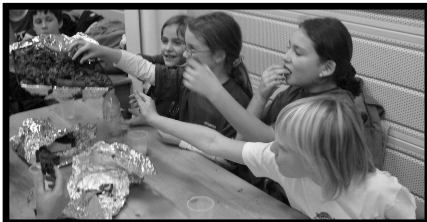
“Qu'est-ce que ça peut être gourmand une fille !!!!”