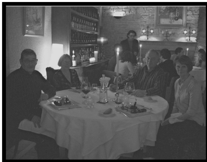
Photo du double mixte