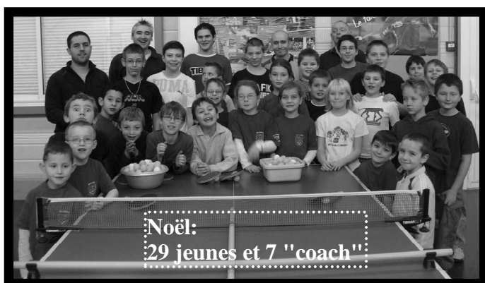
Noël: 29 jeunes et 7 "coach"!