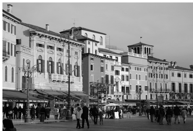
Et beaucoup de beaux souvenirs