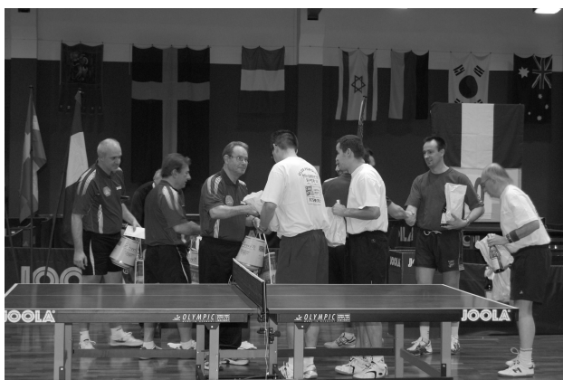
Un peu de compétition...