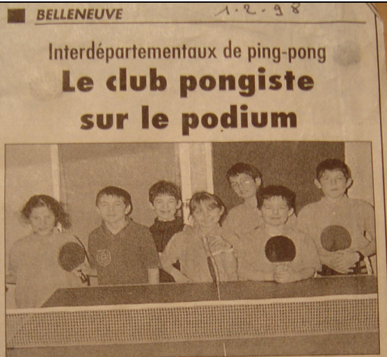
Les jeunes pousses du club