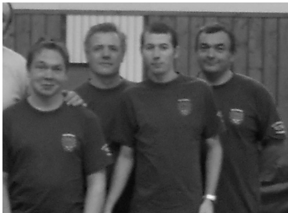
La rencontre à Châtillon

Départementale 3 , Un sans faute ....ou presque.