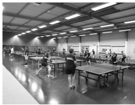
Toutes et tous à la table ...