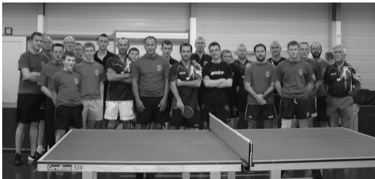
Demi finales : CPB 2 / Lamarche 1 et CPB 3 / Chatillon 3