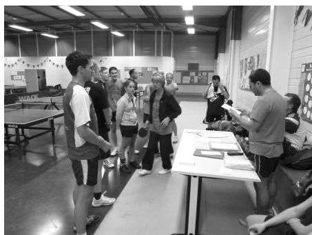
Pas claires, les consignes !!!

Devant la réussite et l'enthousiasme général, il a été décidé de réaliser un "challenge" sur l'année. À la fin de chaque tournoi sera attribué un certain nombre de points à chacun en fonction du classement final de la soirée. Le cumul de ces points donnera un classement définitif à l'issue de la saison. Les formules des autres soirées-tournoi ne sont pas encore arrêtées, tout est ouvert (tournoi de double, par équipe de 2, etc...). Alors, avis à tous : préparez vous bien, des places sont à gagner ou à défendre si vous voulez être le 1er grand vainqueur du "CPB" > le "Challenge des Pongistes Belleneuvois".